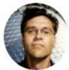
Carl De Keyzer