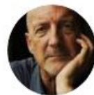
David Alan Harvey