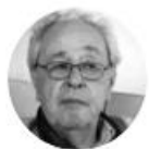
Philip Jones Griffiths