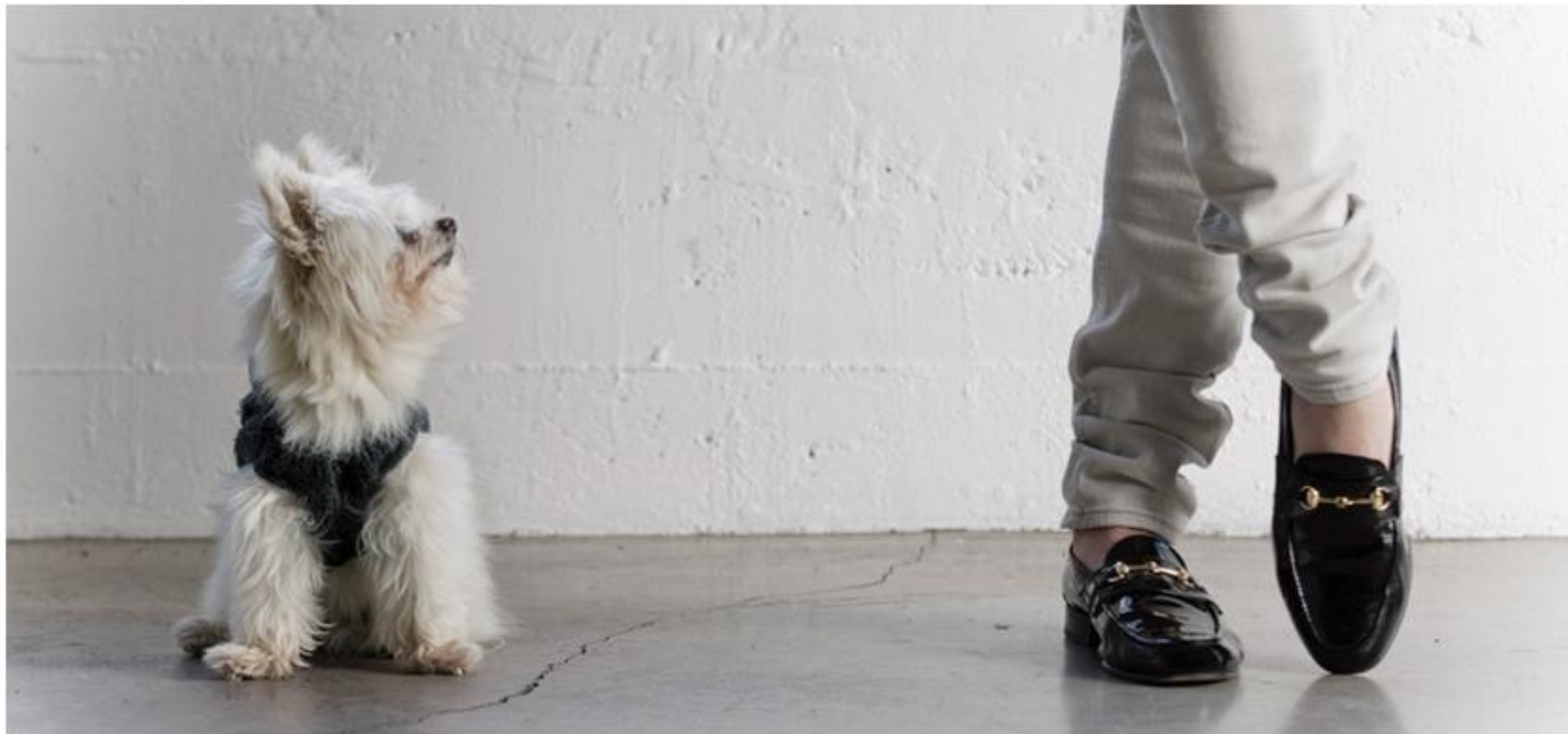
Tiny White Dog Looking Up At A Person. License this photo

AP Images offers a variety of unique rights-managed images and photos commonly used by advertisers and publishers.