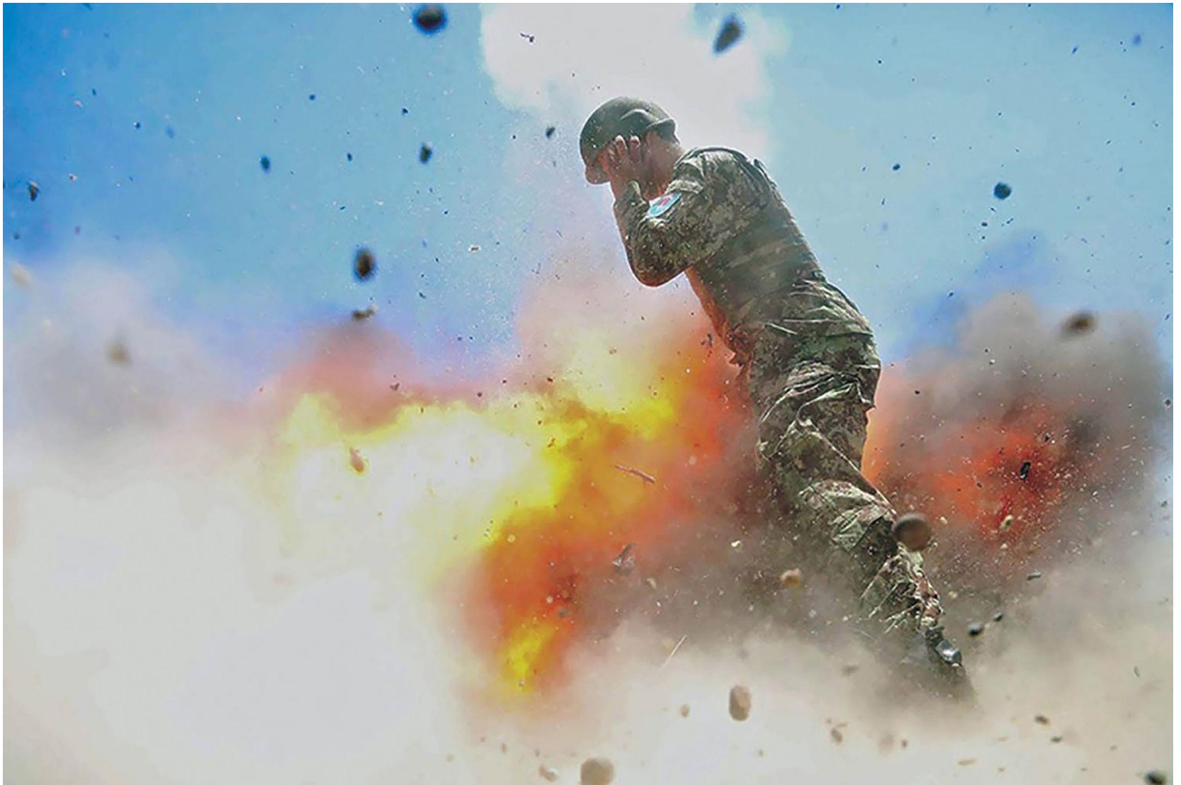
Last photo taken by combat photographer Hilda Clayton seconds before her death.