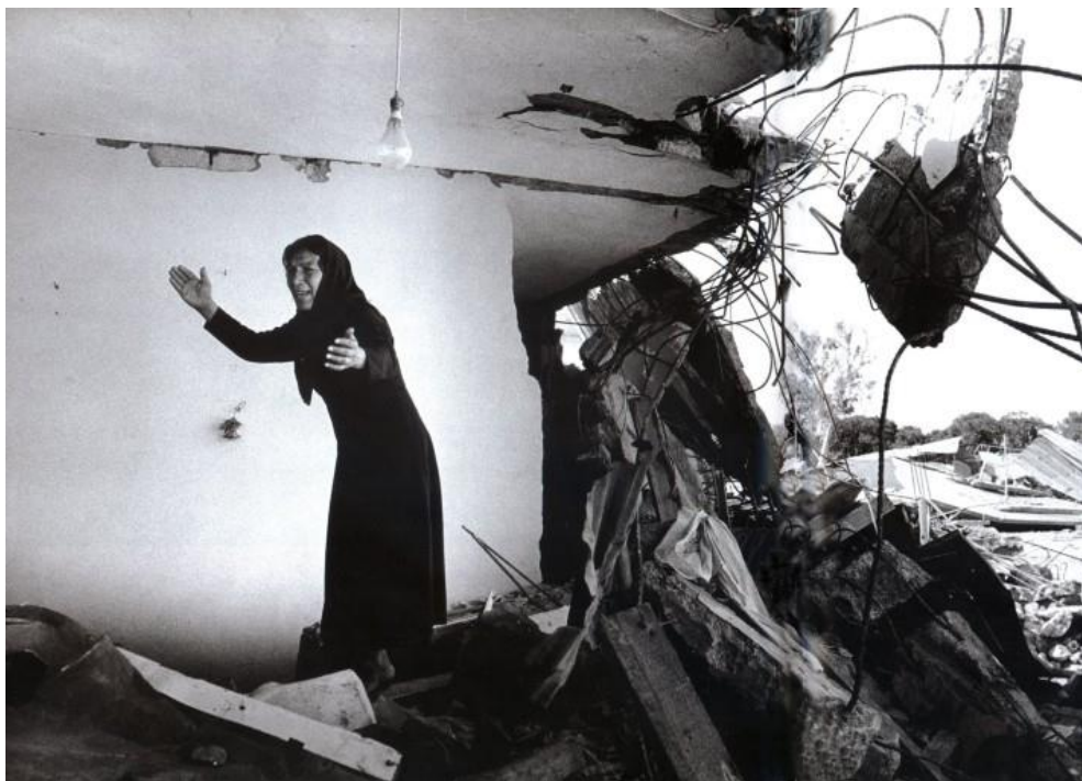
A Palestinian Woman Returning to the Ruins of her House, Sabra, Beirut, 1982

Ένας από τους πιο διάσημους και σεβαστούς φωτογράφους της Βρετανίας, ο Don Mc Cullin αντιστέκεται την ψηφιακή κυριαρχία της φωτογραφίας, αποκαλώντας την "μια εντελώς ψεύτικη εμπειρία" που δεν μπορεί να εμπιστευτεί.