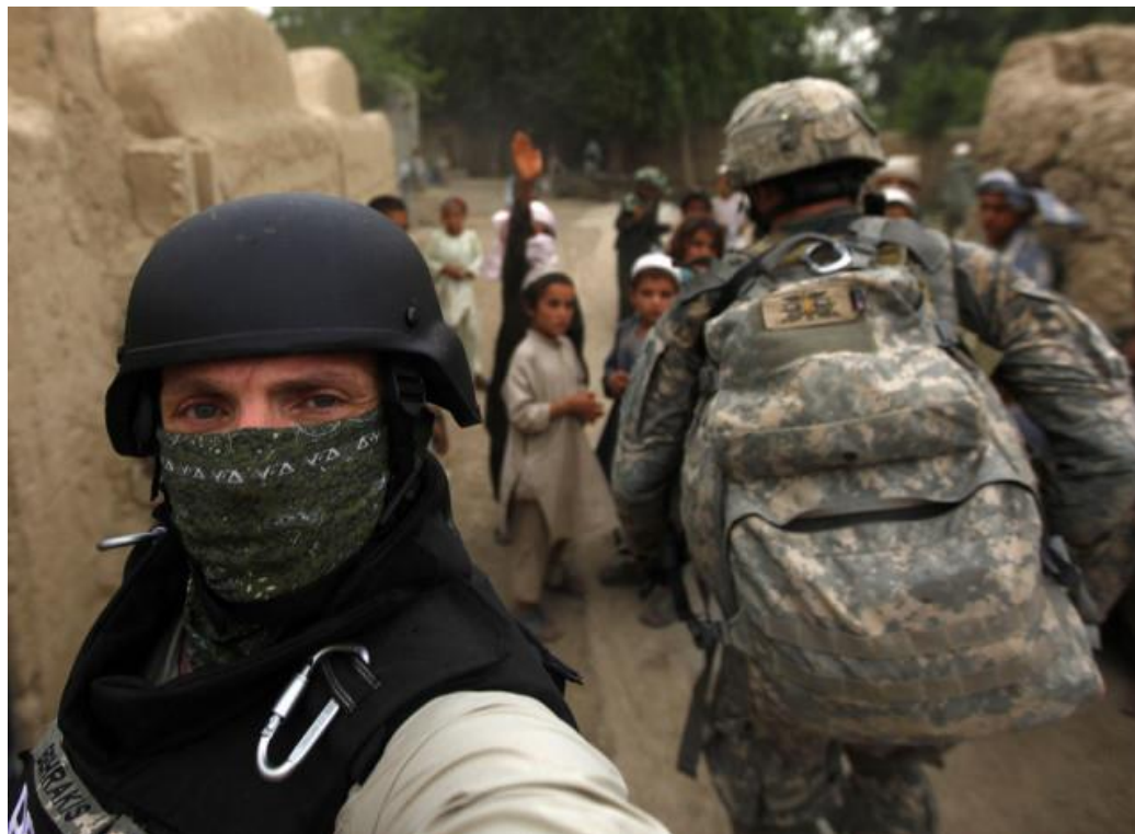
Ο Γιάννης Μπεχράκης στο Αφγανιστάν το 2010

"Ξέρω πολύ καλά ότι μέσα στη δουλειά μου υπάρχουν πολλοί σοβαροί κίνδυνοι. Μια από τις πιο επικίνδυνες αποστολές ήταν το 2000 όταν τραυματίστηκα σε ενέδρα στη Σιέρα Λεόνε. Εκεί έχασε τη ζωή του ο πολύ καλός μου φίλος Kurt Schork όπου οι σφαίρες σταμάτησαν στο σώμα του και δε σκοτώθηκα εγώ"