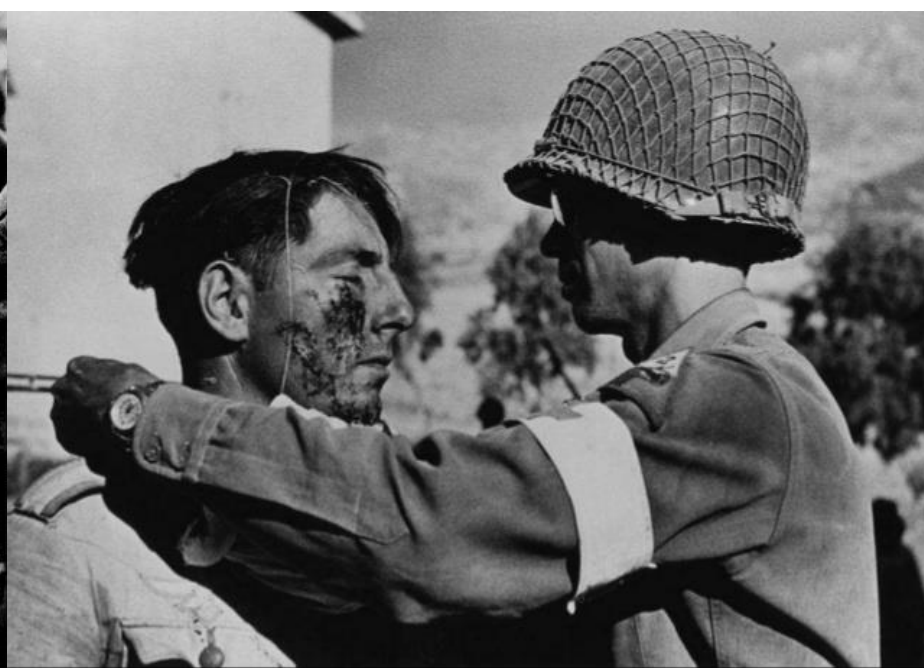
July, 1943. A member of the American Medical Corps treats a German prisoner of war.