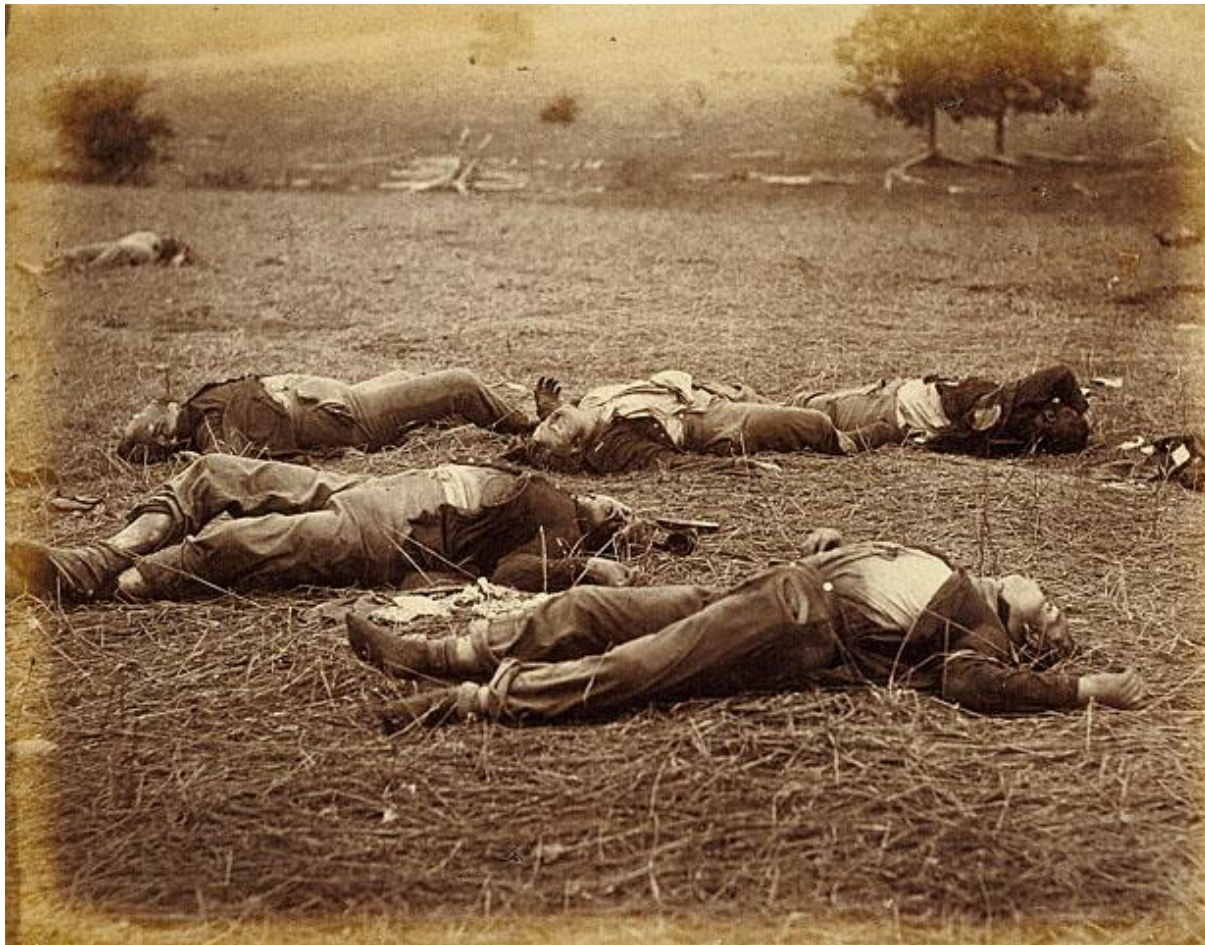
Timothy H. O'Sullivan - Field Where General Reynolds Fell (1863)

Ακόμη εντονότερη ήταν η παρουσία των φωτογράφων στον αμερικανικό Εμφύλιο Πόλεμο (1861-65). Ο Mathew Brady οργάνωσε μία ομάδα δέκα φωτογράφων που κάλυπταν τα διάφορα μέτωπα και βρέθηκαν κοντά στις περισσότερες σημαντικές μάχες. Ανάμεσά τους ξεχωρίζουν οι George N. Barnard, Timothy H. O'Sullivan και Alexander Gardner.