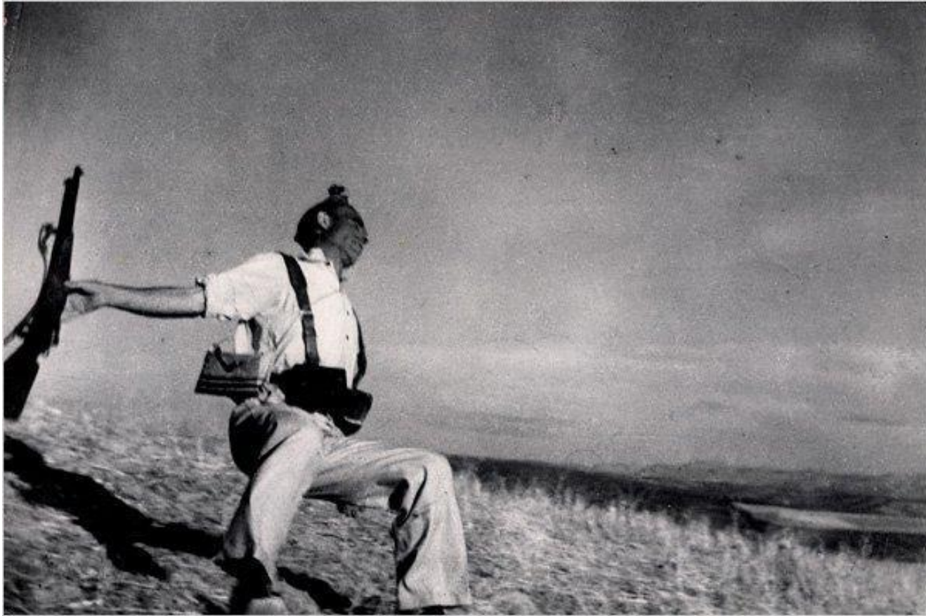
"The Falling Soldier" by Robert Capa