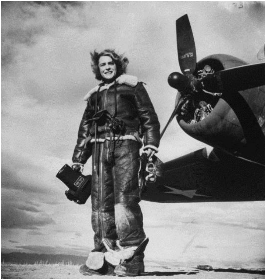
Margaret Bourke-White's favorite self-portrait, made with the U.S. 8th Air Force in 1943