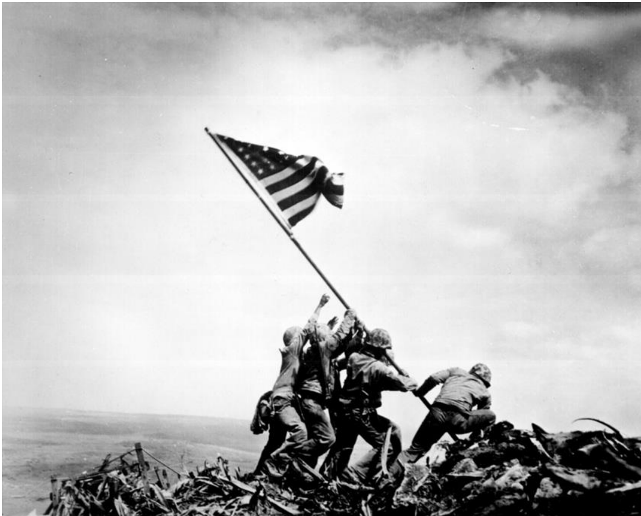
Η στημένη φωτογραφία μετά την κατάληψη της Ίβο Τζίμα.