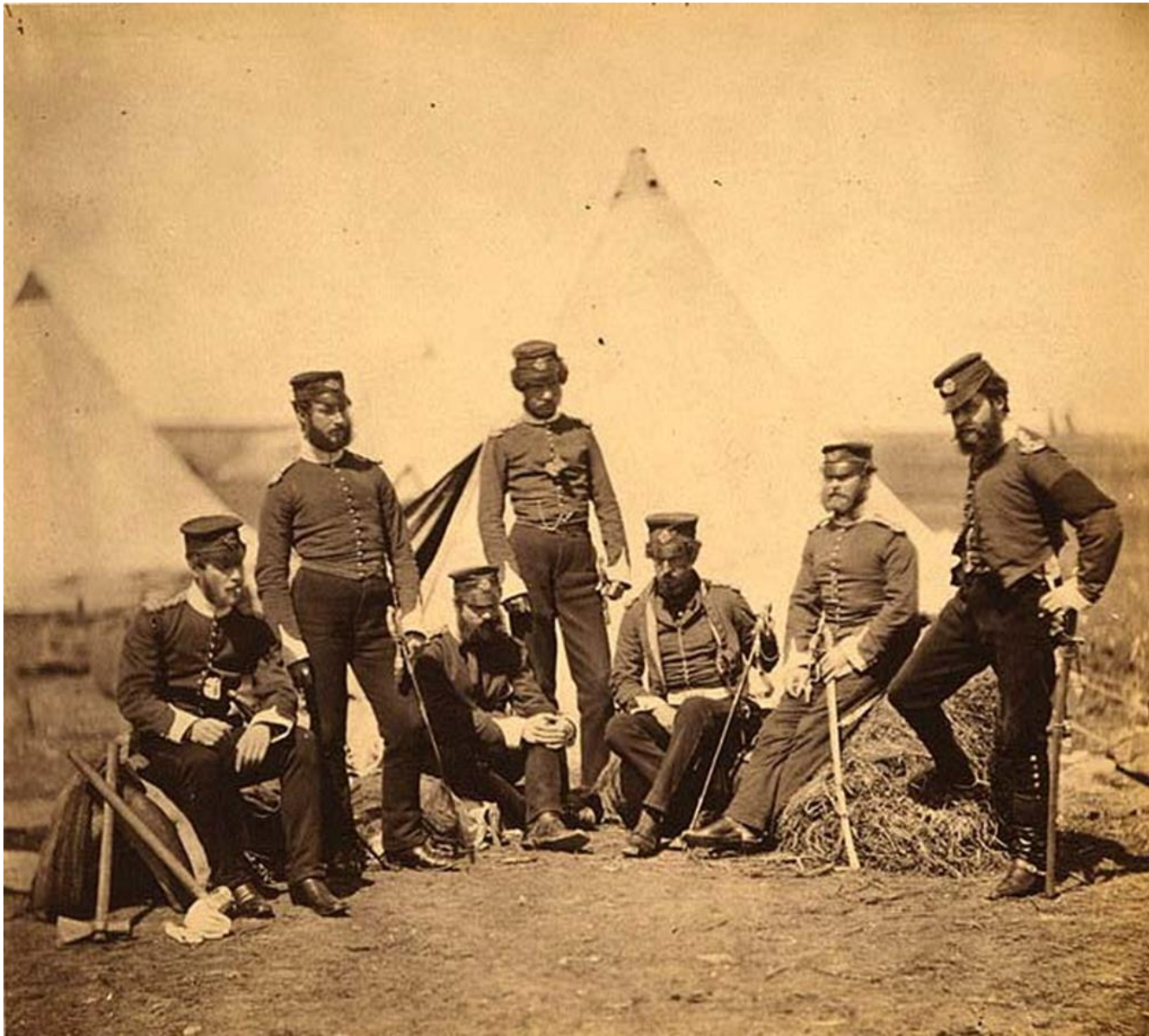
Officers of the 90th Regiment of Foot (Perthshire Volunteers)