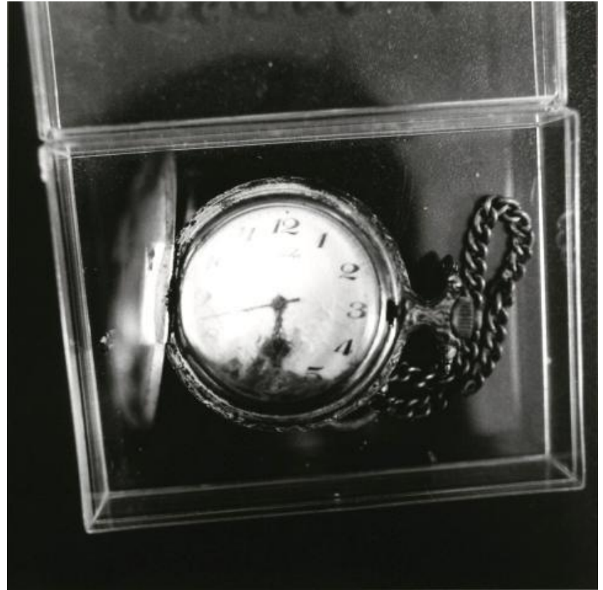
Frauke Eigen, Fundstücke (Found Objects), Kosovo 2000