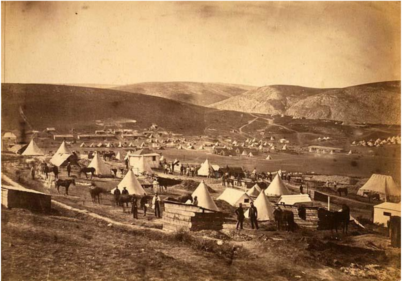
Camp of the 5th Dragoon Guards, looking towards Kadikoi.