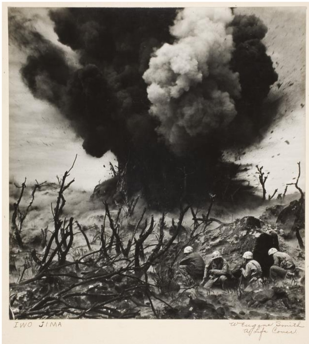
W. Eugene Smith, Ανατίναξη μιας σπηλιάς που συνδέεται με ένα ιαπωνικό οχυρό στην Iwo Jima, 1945