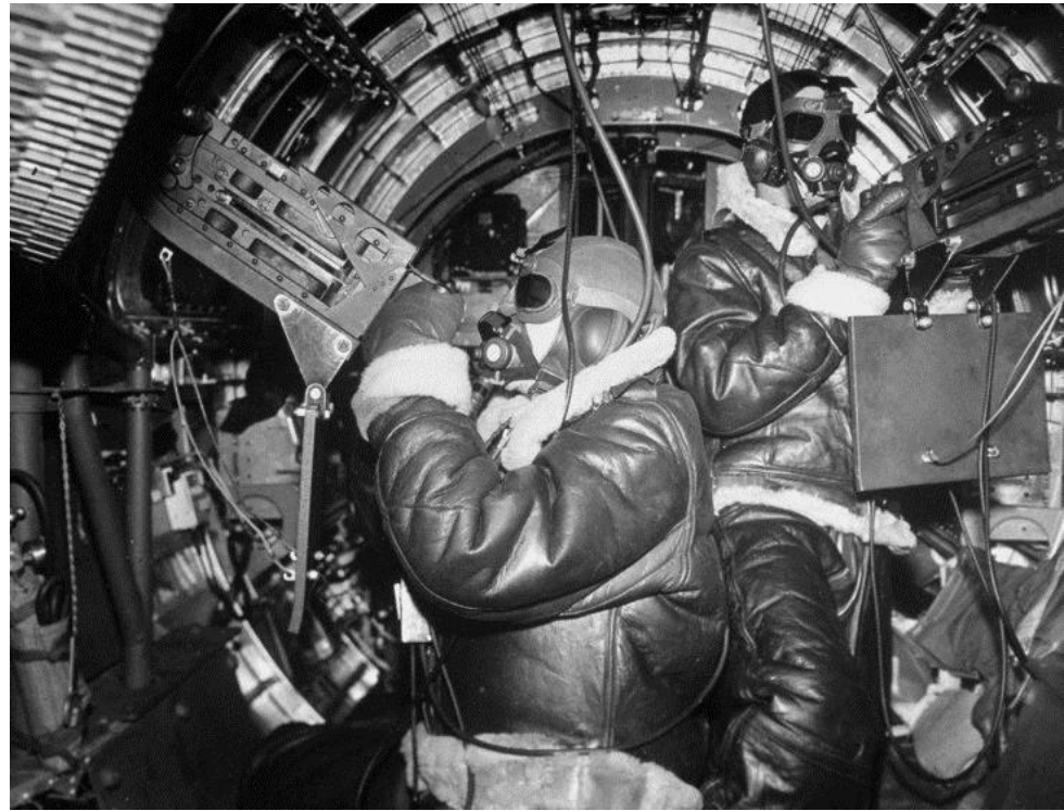
Margaret Bourke-White, Inside a B-17 Flying Fortress, September, 1942.