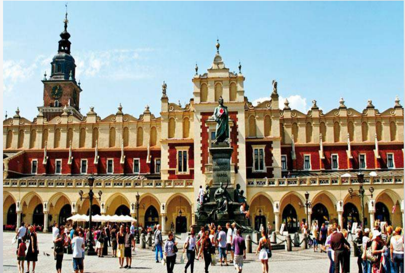
Στο κέντρο της πόλης