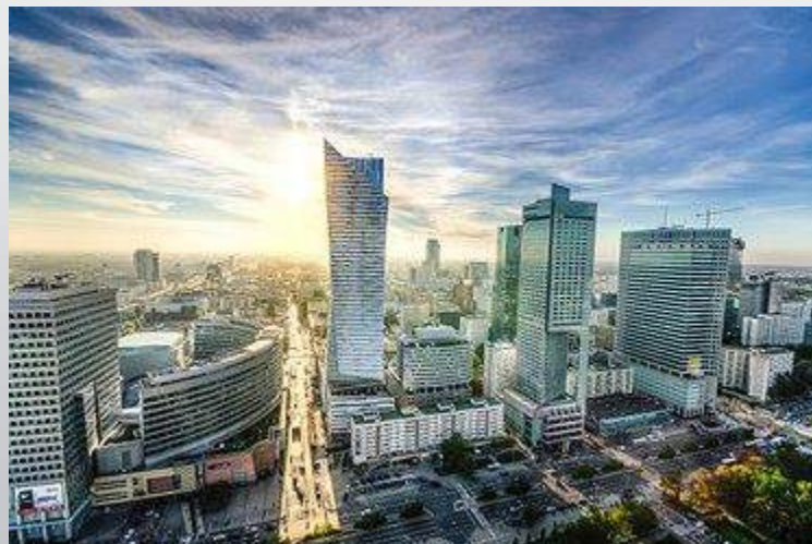
Το οικονομικό κέντρο στη Βαρσοβία