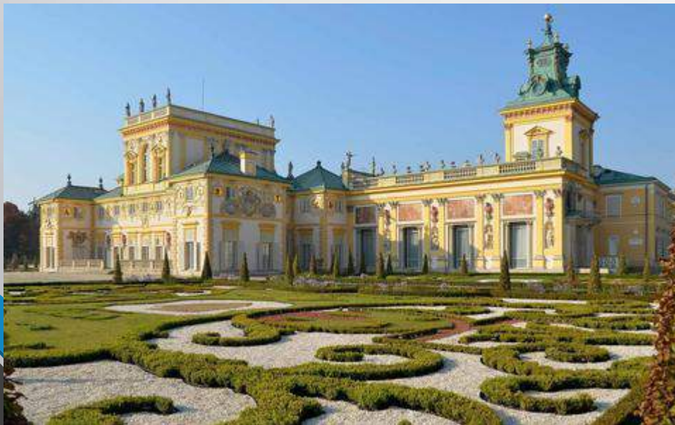
Το ανάκτορο Βιλάνοβ