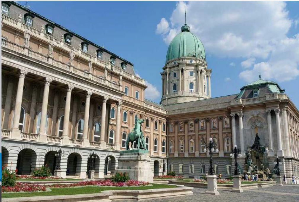
Το βασιλικό ανάκτορο της Βούδας