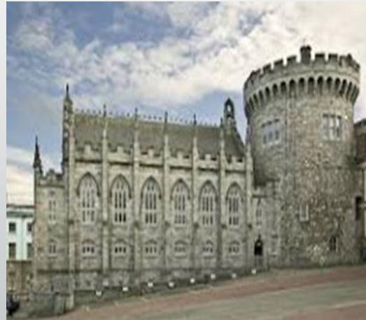
Κάστρο του Δουβλίνου