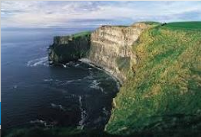
Βράχοι του Μοχέρ