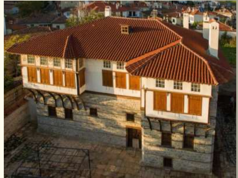
Σιάτιστα Κοζάνης (Αρχοντικό της Πούλκως)