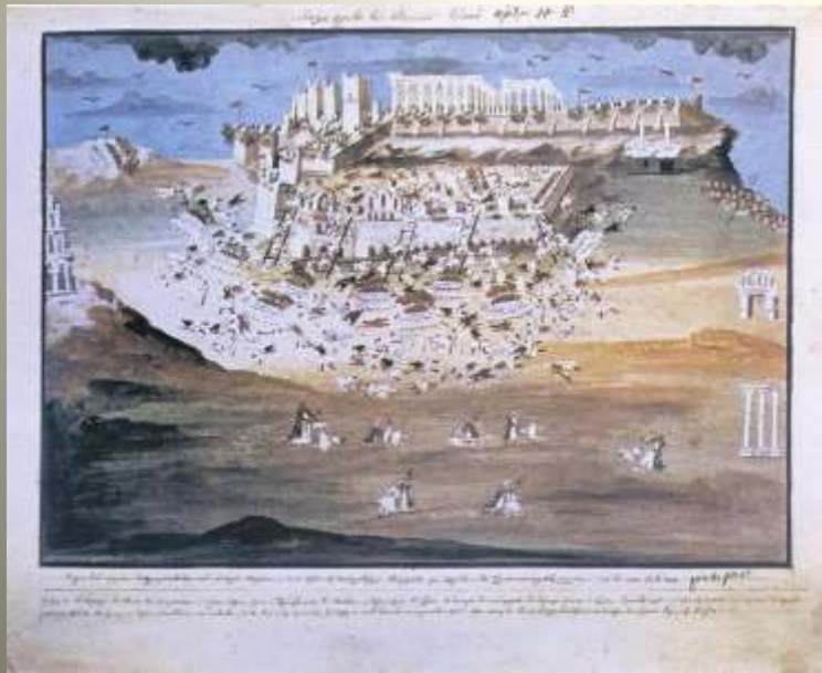
Η πολιορκία των Αθηνών